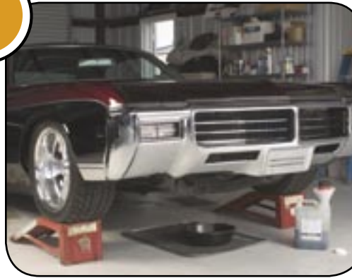
1969 Buick Riviera