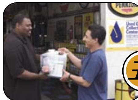
Mr. Lubrication, Seaside