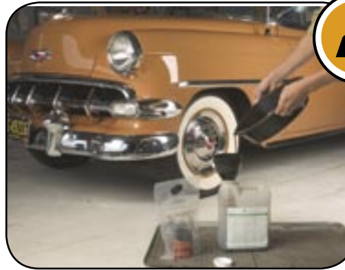
Year Make Model